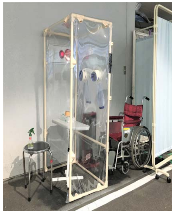
※ 検査用に隔離スペースを設置しております